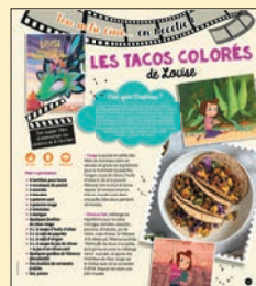
Recette de cuisine "les tacos colorés de Louise"