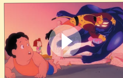
Bande-annonce - teasers