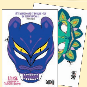
Masque à fabriquer

Programmez votre séance déguisée avec les masques Jaguar et Serpent à commander chez Gebeka en écrivant à info@gebekafilms.com