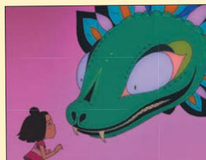
Dossier de presse