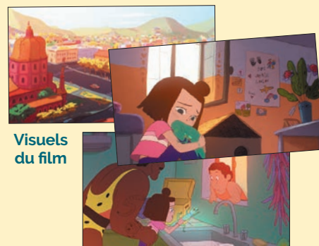
Visuels du film