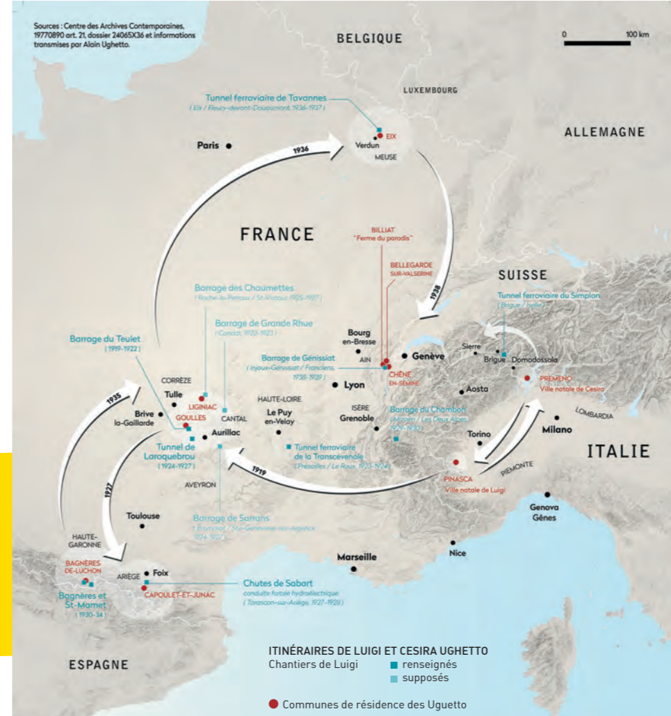
Carte Emmanuelle Bournay.

A travers leur destin, nous traversons donc l'histoire d'une main d'œuvre, celle de travailleurs émigrés et nomades qui, c'était hier pour les Italiens, c'est aujourd'hui pour les Africains, vendent leur force de travail et contribuent au développement agricole et industriel de nombreuses régions françaises, travaillant dans des conditions à peine plus enviables que celles qu'ils ont laissées au pays.