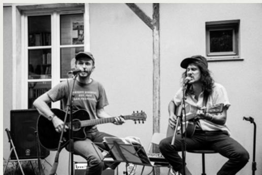
Sébastien Hoog et Xavier Polycarpe

MUSIQUE ORIGINALE PAR SÉBASTIEN HOOG ET XAVIER POLYCARPE / SORTIE LE 1 ER DÉCEMBRE 2021