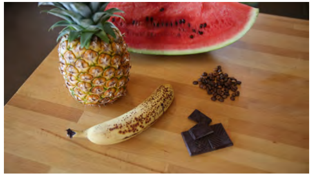
LES 5 FRUITS