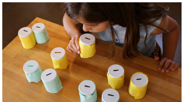
ET ON SENT !!