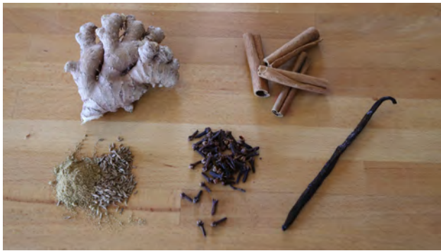
LES 5 ÉPICES